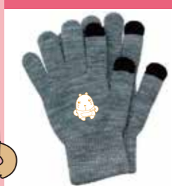
シンプルタッチグローブ