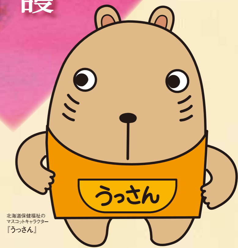
北海道保健福祉の マスコットキャラクター 『うっさん』