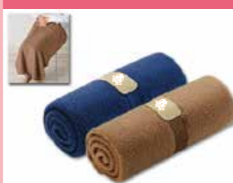
ベルト付ロールブランケット