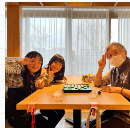
オセロが強いおばあちゃん