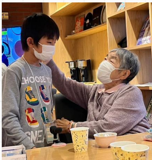
ほめられて嬉しい