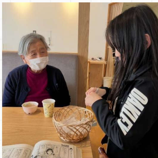
可愛いと言ってくれる