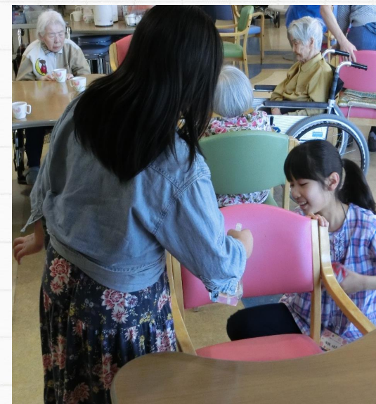
テーブルや椅子拭き