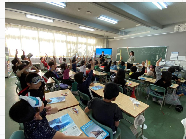
コミュニケーション授業