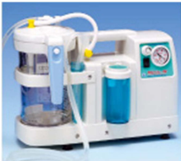
卓上型吸引器ミニックW